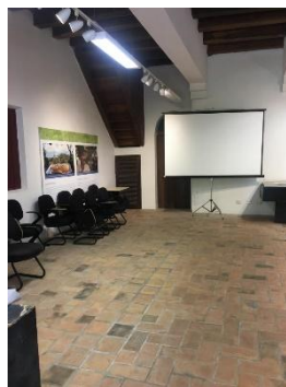
ESPAÇO 01 DAS OFICINAS DE DANÇA E