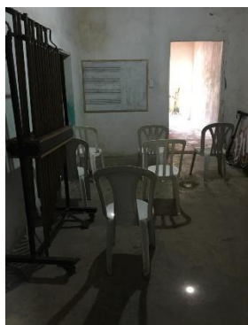
SALA 02 DAS OFICINAS DE MÚSICA