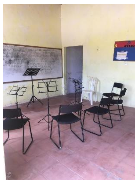
SALA 01 DAS OFICINAS DE MÚSICA