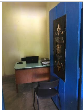
SALA DA COORDENAÇÃO

Criado pela Lei Federal 8060/1990 Instituído pela Lei Municipal 2790/2012