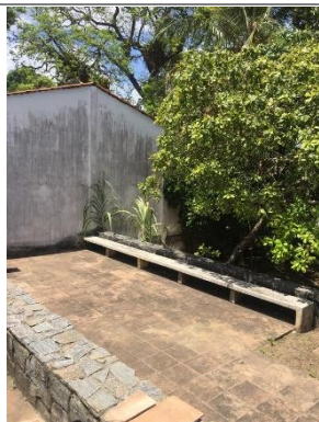
ESPAÇO 02 DAS OFINAS DE DANÇA E TEATRO

Criado pela Lei Federal 8060/1990 Instituído pela Lei Municipal 2790/2012